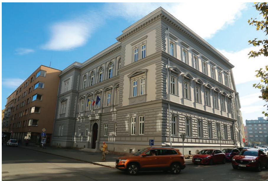
Budova Filozofické fakulty Ostravské univerzity po rekonstrukci (3. září)