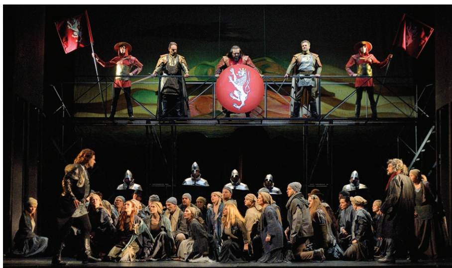
Sborová scéna z opery Bedřicha Smetany Braniboři v Čechách uvedené v NDM (22. února)

to, že samice v ostravské zoo nedokázala se svým předchozím partnerem zabřeznout. Příčinou byl nižší věk samce, nad kterým samice dominovala. Starší lev bude pravděpodobně pro ostravskou lvici přirozenějším sociálním partnerem