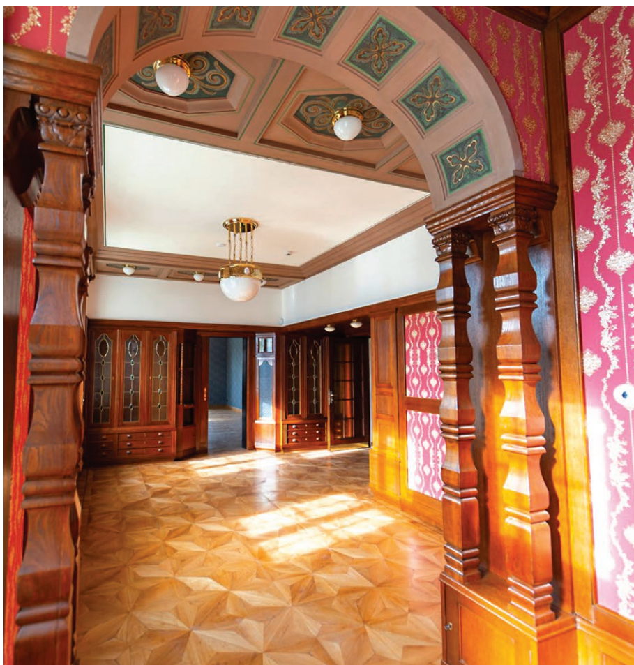
Interiér zrekonstruované Grossmannovy vily (26. března)

28. října v Moravské Ostravě. K hlavním stavebním úpravám patřila obnova všech zachovalých hodnotných stavebních prvků a střechy. Mezi uměleckořemeslné a restaurátorské práce náležely mj. repase oken, dveří, obnovení systému venkovních historických žaluzií, zhotovení repliky původního schodiště v hale, oprava systému teplovzdušného vytápění, restaurování štukové výzdoby, repliky původních obkladů a dlažeb. Zrenovována byla také přilehlá zahrada. Pro návštěvníky se vila poprvé otevřela 4. dubna. Díky zájmu prvních návštěvníků se také podařilo vybrat 45 000 Kč ze vstupného, které byly určeny na podporu aktivit Mobilního hospice Ondrášek, o. p. s.