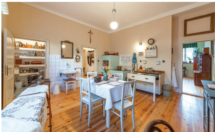
Interiér kuchyně s historickým nábytkem v muzeu v Jubilejní kolonii (4. února)