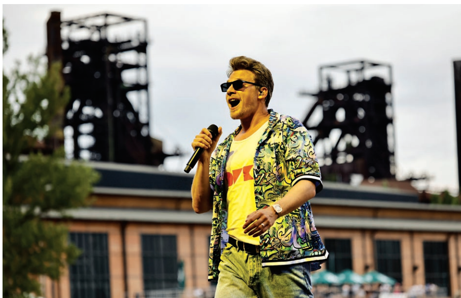
Zpěvák Vojtěch Dyk při vystoupení na festivalu Colours of Ostrava (17. července)

Mezi hlavní hvězdy patřili britský zpěvák Sam Smith, rocková legenda Lenny Kravitz nebo zpěvák James Blake. Z českých interpretů se představili zpěvačka Lenny, skupiny Bratři Ebenové, Tata Bojs, Mig 21 a další. Vystoupit měla také skupina Queens of the Stone Age, avšak ze zdravotních důvodů byla nucena koncert i celé své turné zrušit. Místo ní se představil americký zpěvák Tom Morello. Součástí programu byla diskusní scéna Meltingpot, na níž vystoupili např. americký psycholog Dan Ariely, britský spisovatel Irvine Welsh, britský biolog Rupert Sheldrake nebo generální ředitelka CERN Fabiola Gianotti. Mezi hosty festivalu zavítal rovněž prezident Petr Pavel