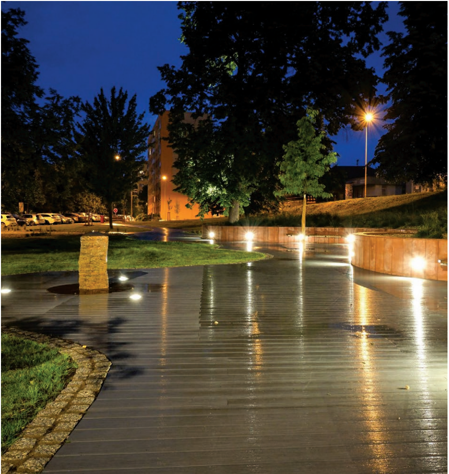
Zrevitalizovaný park u Zámku Zábřeh (26. srpna)