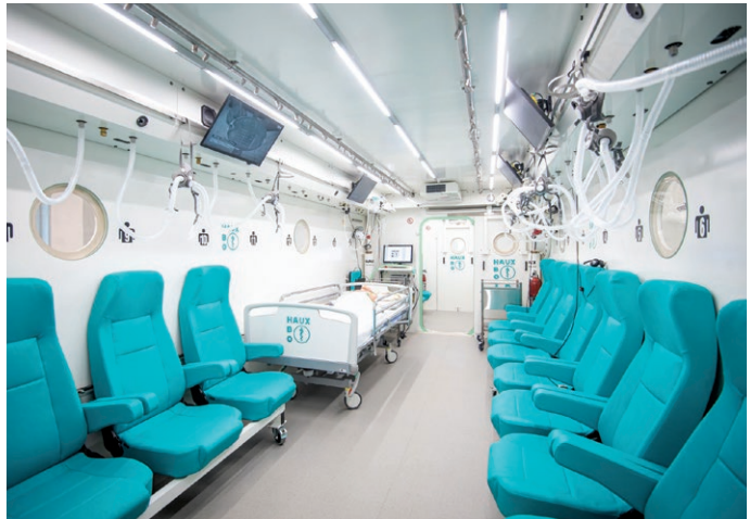
Hyperbarická komora v Městské nemocnici Ostrava (1. března)