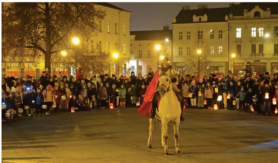
Svatý Martin na bílém koni při akci pořádané pro žáky Waldorfské základní školy a mateřské školy Ostrava, p. o. (11. listopadu)