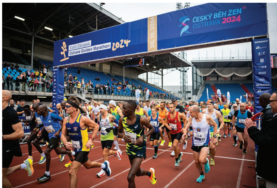
Účastníci Zlatého maratonu Emila Zátopka (26. října)

nejlepší systém městské hromadné dopravy, zajišťované Dopravním podnikem Ostrava a. s.