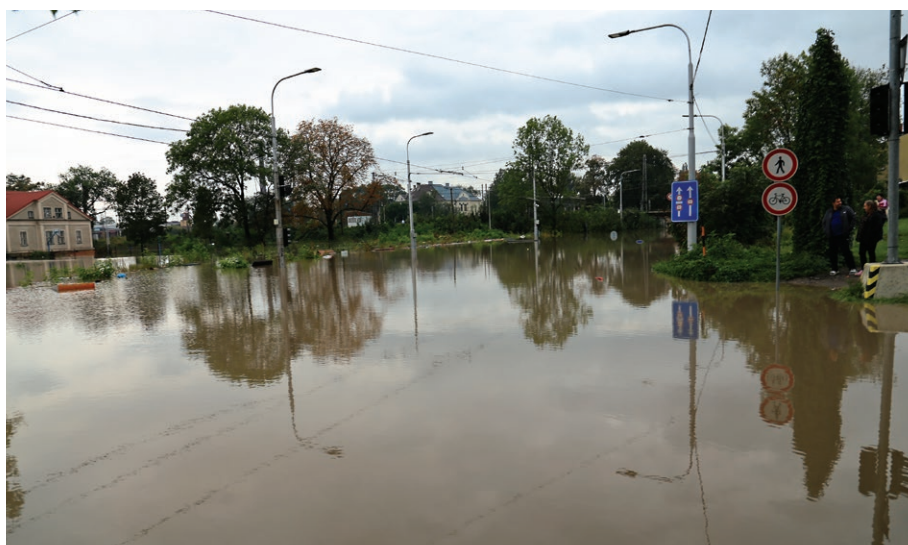
Zatopená část Přívoze u podjezdu na ulici Sokolské (16. září)

a hlavního nádraží v Přívoze. Došlo k uzavření dálnice D1 v obou směrech od objezdu v ulici Slovenské až ke státní hranici s Polskem. Problémy měla i městská doprava. V Ostravě řada linek jezdila odklonem, v některých úsecích tramvaje nahradily autobusy. Trolejbusy vzhledem k výpadkům elektrického proudu jezdily podle nedělních jízdních řádů. V Městské nemocnici Ostrava byla uzavřena protialkoholní záchytná stanice, omezeny byly akutní i plánované operace a provoz nemocniční kuchyně a lékárny. Na Černé louce bylo zřízeno evakuační centrum, které využili lidé ohrožení ve svých domovech povodňovou vlnou. Tamtéž fungovalo sběrné místo materiální pomoci. Na určitou dobu byla přerušena výuka ve Waldorfské základní škole a mateřské škole Ostrava, p. o., v ulici Na Mlýnici v Přívoze, pobočce Základní školy Ostrava, Gebauerova 8, p. o., v Ibsenově ulici v Přívoze, Základní škole Ostrava-Petřkovice, Mateřské škole Ostrava-Petřkovice, U Kaple 670, p. o.,