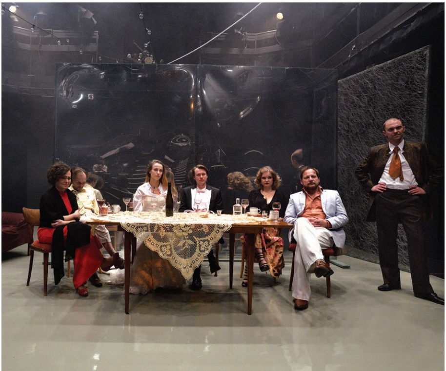
Scéna z představení Děti slunce uvedeného v KSA (13. ledna)