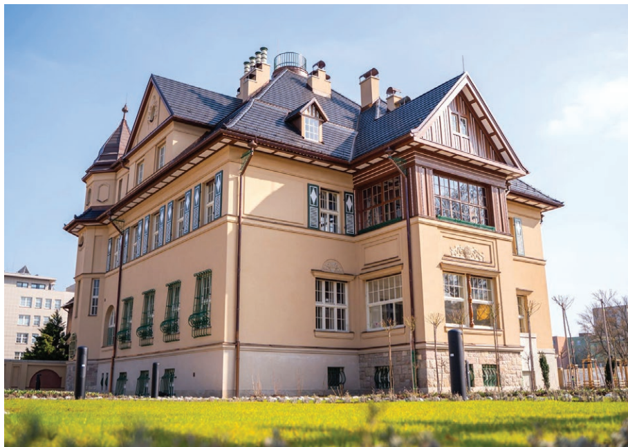
Grossmannova vila v Moravské Ostravě po rekonstrukci (26. března)