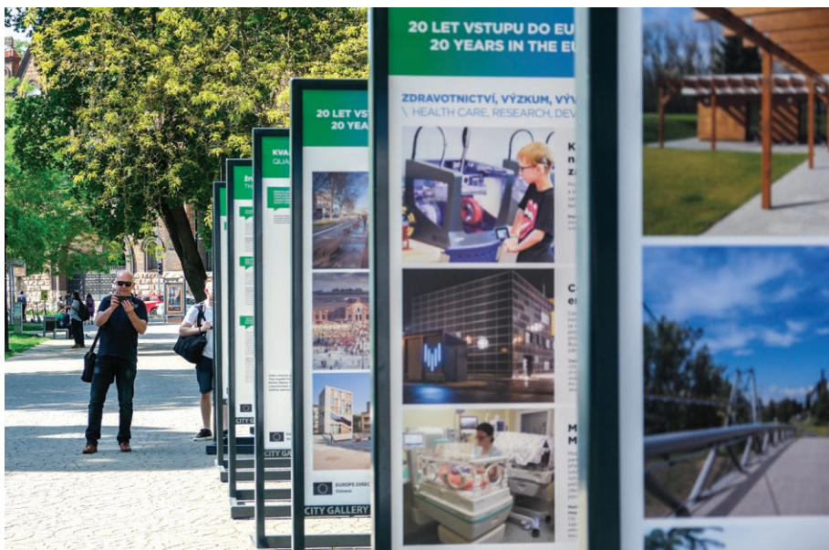
Panely výstavy k 20. výročí vstupu ČR do Evropské unie v Husově sadu (30. dubna)