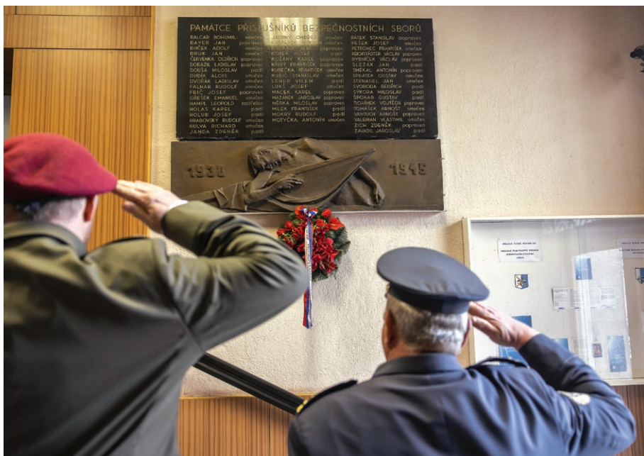
Príslušníci Armády ČR při pietním aktu k 85. výročí zahájení okupace Ostravy (14. března)