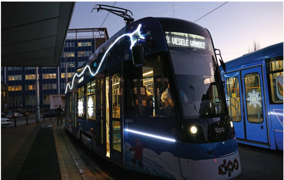
Vánoční tramvaj Dopravního podniku Ostravy (2. prosince)