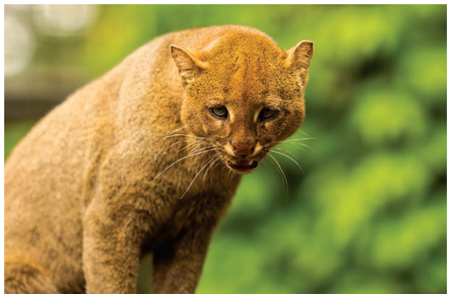
Kočkovitá šelma jaguarundi v ostravské zoo (2. května)