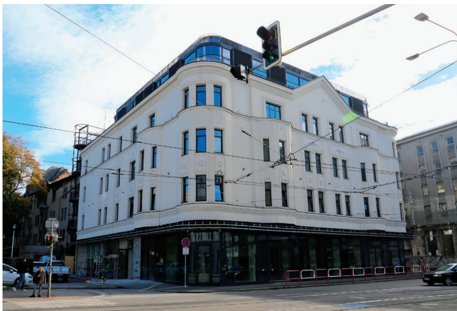
Zrekonstruovaná budova bývalého obchodního domu Ostravica-Textilia (5. června)