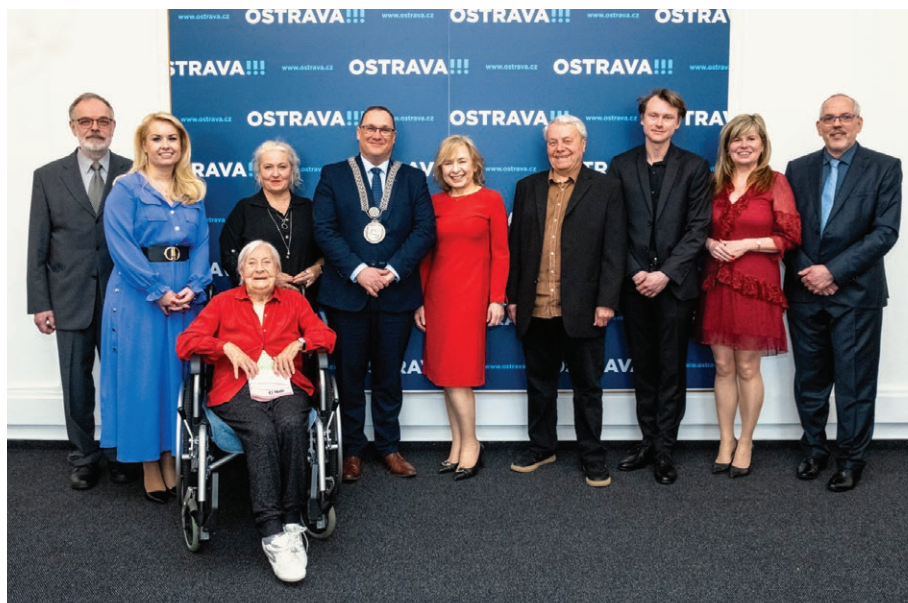
Držitelé Cen města Ostravy s primátorem Janem Dohnalem a dalšími členy vedení města (27. března)