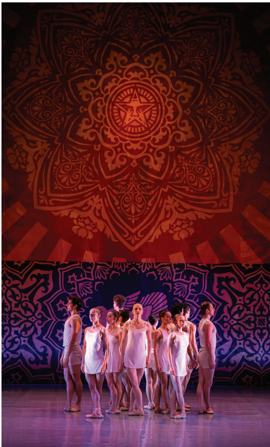
Scéna z baletního večera NDM Rapsodie Bohemia (11. dubna)