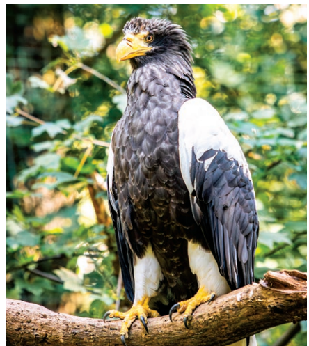
Orl východní v ostravské zoo (25. srpna)

▶ v Zoologické zahradě a botanickém parku Ostrava, p. o., byl zahájen chov nového druhu, majestátního orla východního, který je největším orlem světa.