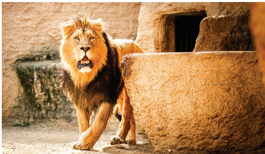
Lev indický v ostravské zoo (20. února)