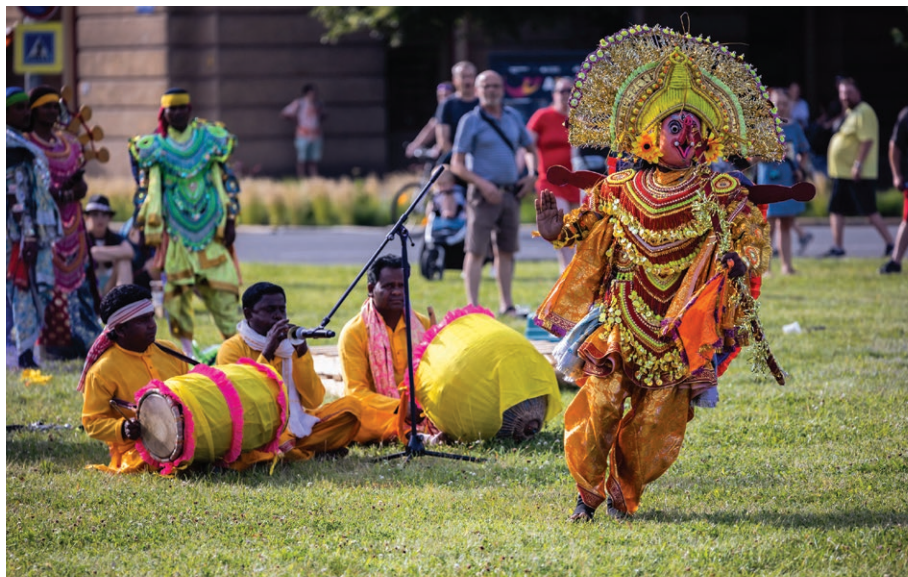
Indický soubor Biren Kalindi Chhau Dance Ensemble na Festivalu v ulicích (21. června)

► den otevřených dveří se konal v areálu OZO Ostrava s. r. o. ve Frýdecké ulici v Kunčicích. Na programu byly prohlídka automatické třídící linky směsného komunálního odpadu, přehlídka nejnovějších svozových vozidel, soutěže a workshopy