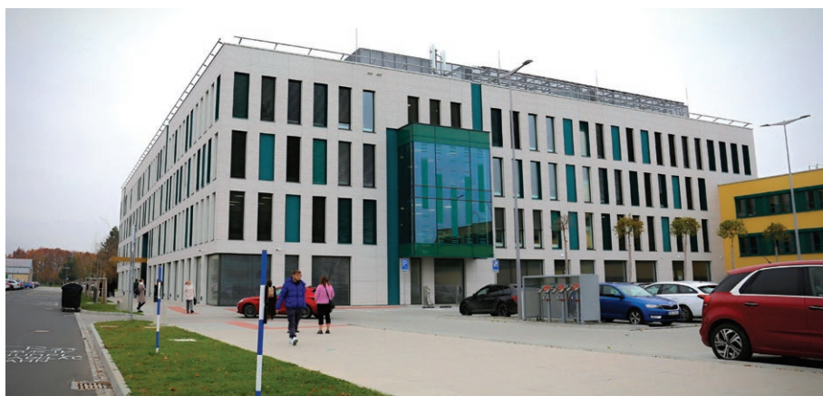
Nová budova Ekonomické fakulty VŠB-TUO v Porubě (9. září)