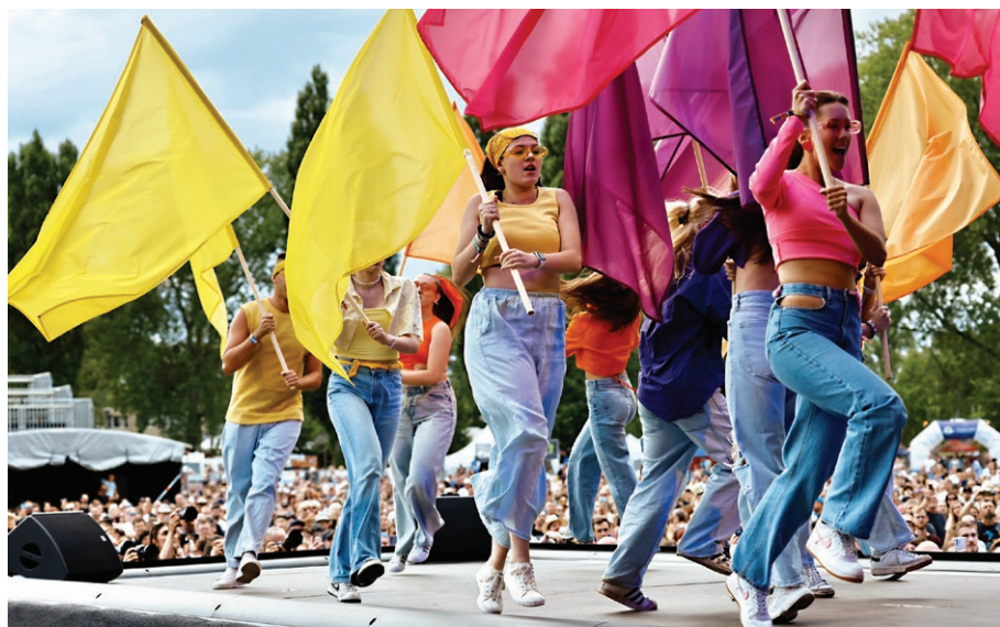
Zahájení festivalu Colours of Ostrava (17. července)