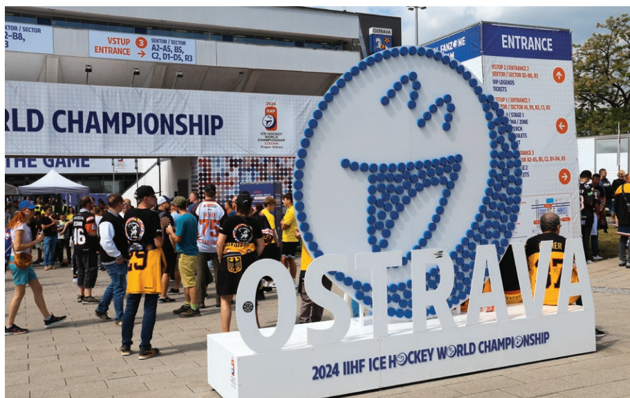
Fanoušci před zápasem mistrovství světa v hokeji před Ostravar Arénou (21. května)

části play-off se pak utkaly výběry Švýcarska, Německa, Švédska a Finska, z nichž postoupily do semifinále v Praze reprezentace Švédska a Švýcarska. Zlaté medaile nakonec vybojovala reprezentace České republiky. Pro fanoušky v Ostravě byla po dobu konání mistrovství u Ostravar Arény k dispozici fanzóna, kde byly instalovány dvě velkoplošné obrazovky a probíhal zde také doprovodný program. Vzhledem k tomu, že český tým se probojoval do semifinále a následně do finále, byla další fanzóna zřízena přímo na Masarykově náměstí, kde také stovky fanoušků oslavily zlaté medaile českých hokejistů