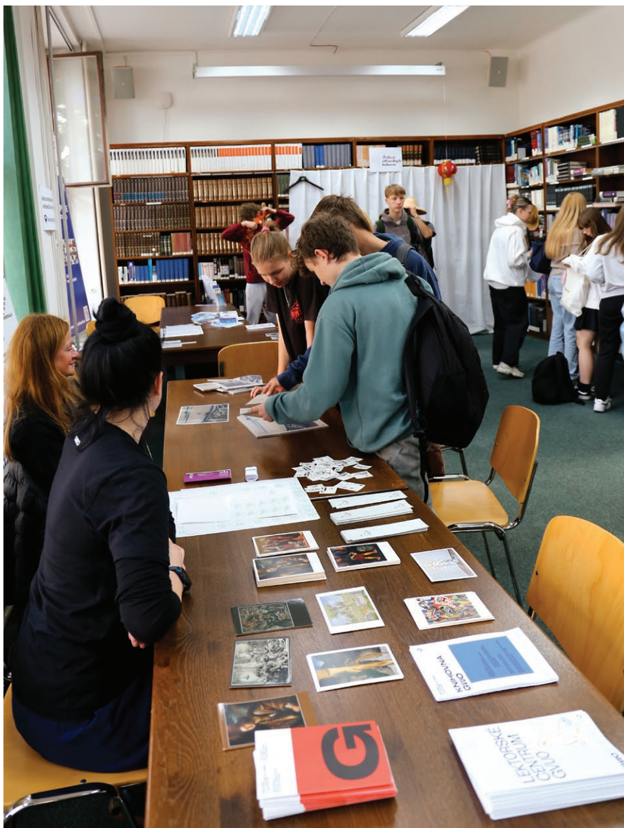
Žáci řeší úkoly na Festivalu ostravských knihoven (10. října)