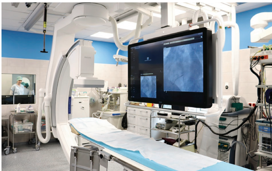
Moderní angiolinka v Městské nemocnici Ostrava (20. února)