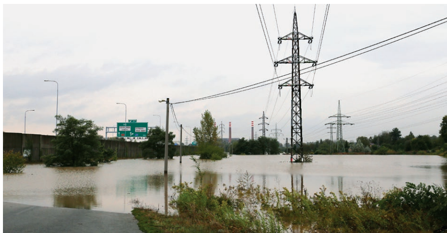
Řeka Odru vylitá ze břehů v Hošťálkovicích (16. září)