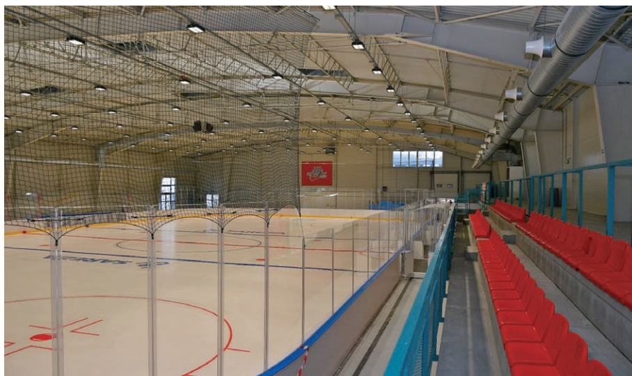
Ledová plocha a část tribuny ve rekonstruovaném Multifunkčním areálu v Porubě (7. listopadu)