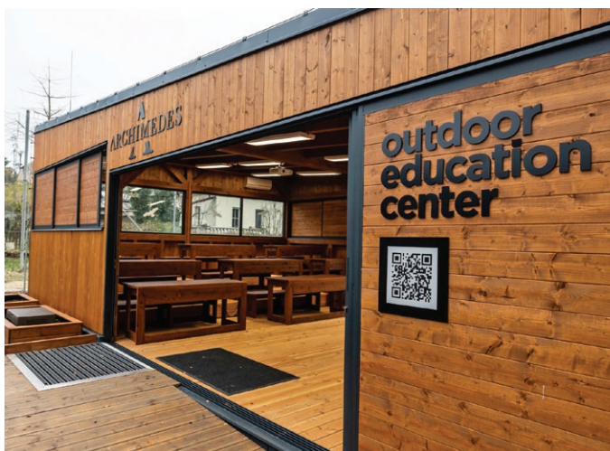
Venkovní učebna Archimedes v Radvanicích (27. listopadu)