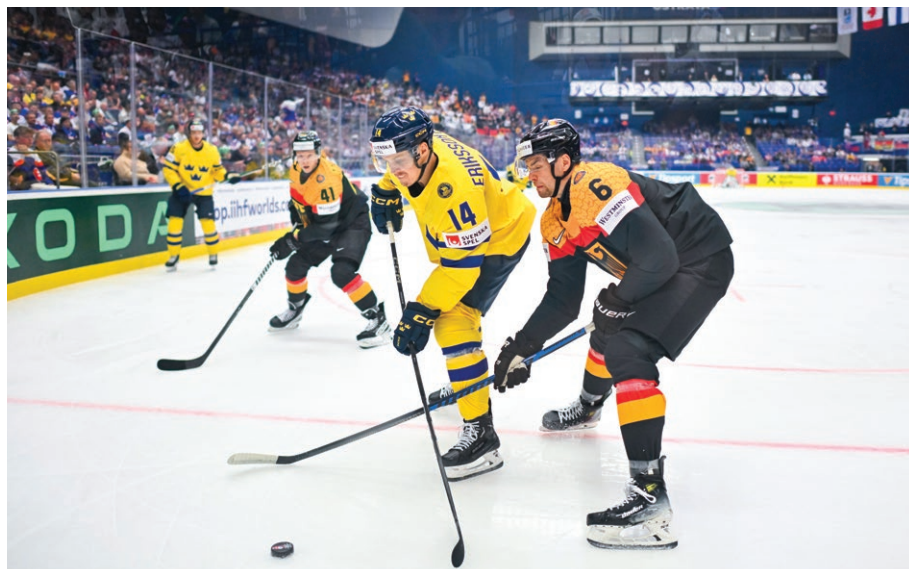
Záběr z utkání na mistrovství světa v hokeji mezi týmy Švédska a Německa (13. května)

▶ v Ostravar Aréně proběhly zápasy skupiny B a play-off 87. mistrovství světa v hokeji. V základní skupině se v Ostravě představily týmy Slovenska, Německa, Švédska, USA, Francie, Kazachstánu, Polska a Lotyšska. V ostravské