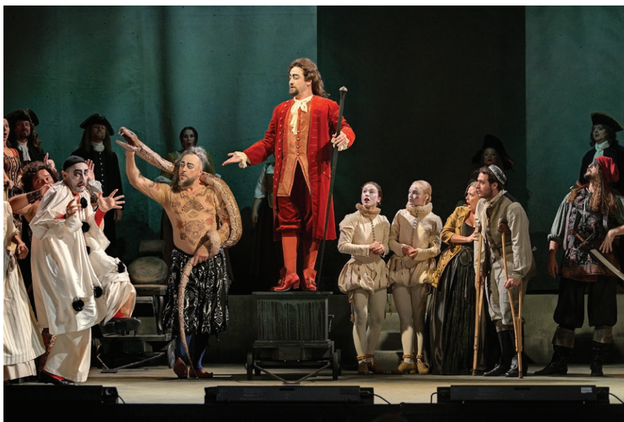
Sborová scéna z opery Pavla Haase Šarlatán uvedená v NDM (10. října)