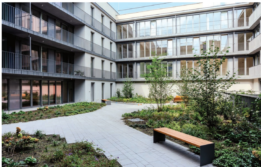
Atrium obytného komplexu Nové Lauby v Moravské Ostravě (9. září)