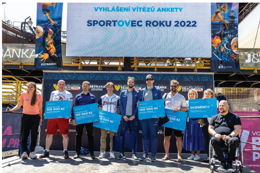
Držitelé ocenění ostravský Sportovec roku 2023 (9. června)