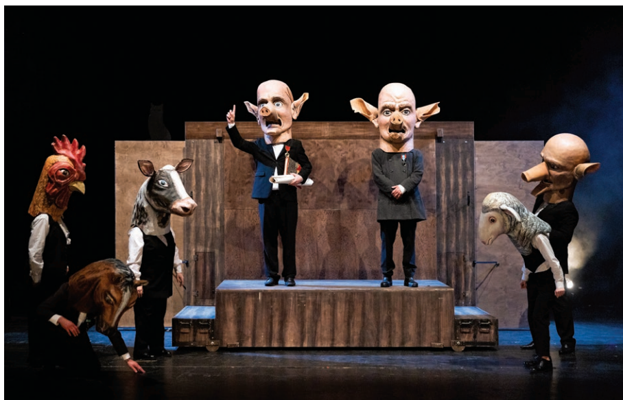
Scéna z inscenace Farma zvířat uvedené v DLO (8. března)