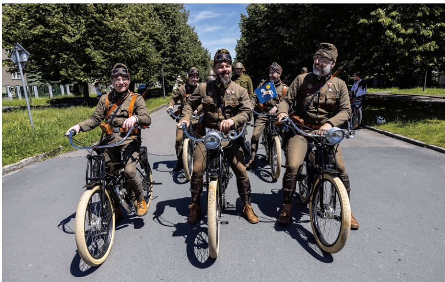
Členové Československé obce legionářské na historických motocyklech při slavnostním průvodu v rámci oslav 100. výročí vzniku Velké Ostravy (15. června)