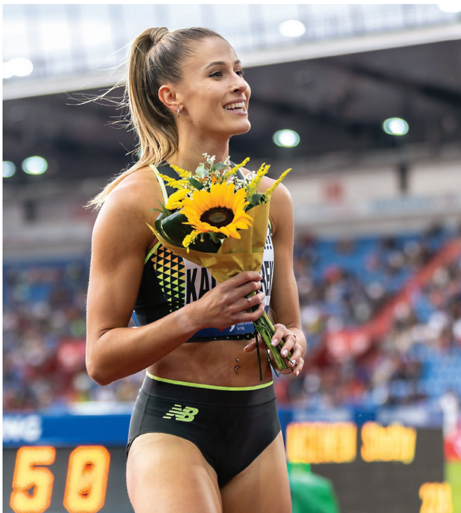
Vítězka závodu v běhu na 400 m na mítinku Zlatá tretra Natalia Kaczmarek z Polska (28. května)