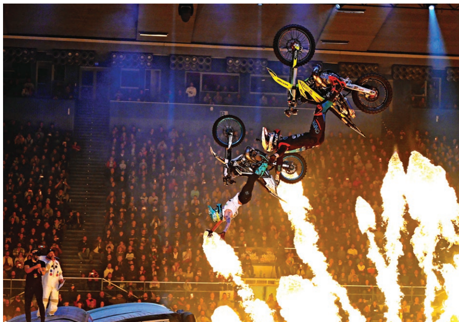
Akrobatické triky motocyklových jezdců v show Overcoming Gravity (2. listopadu)

▶ na programu 41. ročníku Velké ceny Ostravy v krasobruslení v Multifunkčním areálu v Porubě byly soutěže v osmi věkových a výkonnostních kategoriích ve věkovém rozmezí 10-19 let