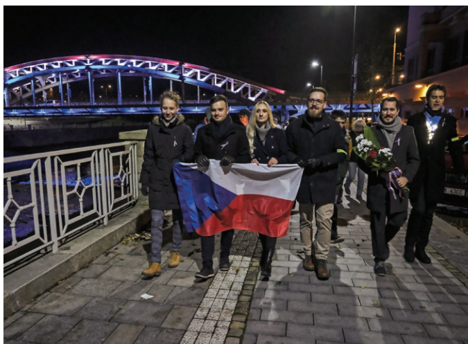
Vysokoškolští studenti v průvodu u příležitosti 35. výročí sametové revoluce (17. listopadu)